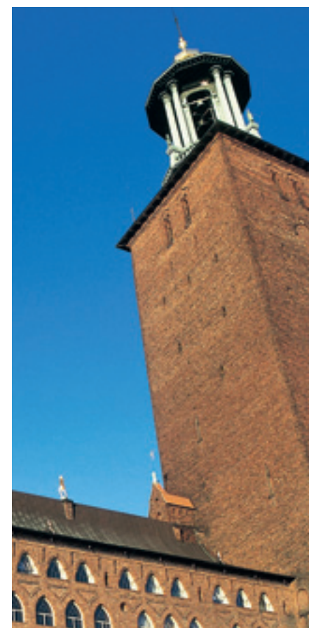
Skandinaviens stadshus? Budskapet Stockholm – The Capital of Scandinavia har fått fäste och erkännande i medvetandet hos både invånare och besökare.

Visionen om det framtida Stockholm är ett strategiskt åtagande från Stockholms stads sida. Alla stadens nämnder och bolagsstyrelser får i uppdrag att arbeta i visionens riktning i sina respektive verksamheter. Visionen kommer därmed genom prioriteringar och konkretiseringar att sätta sin prägel på det utvecklingsarbete som bedrivs inom staden. Att följa utvecklingen och utvärdera insatserna för att nå visionen kommer också att vara en viktig uppgift.