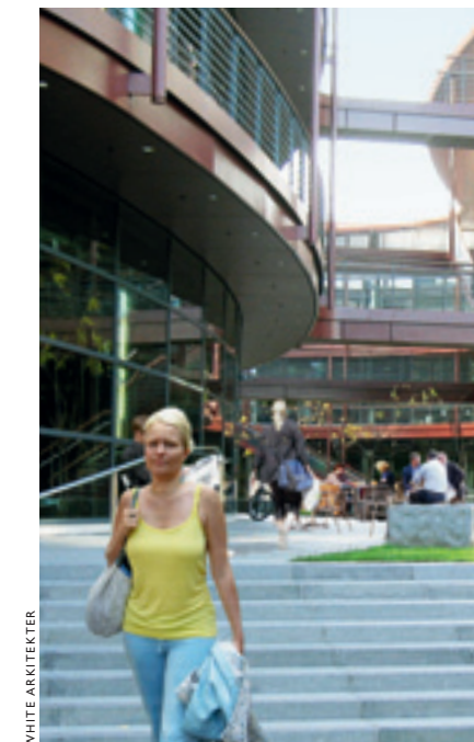
Kunskapens träd. Nya idéer och innovationer spirar vid Karolinska–Norra Station, där utbildning och forskning vuxit samman med företag och näringsliv.

Internationell marknadsföring och profilering blir allt viktigare i takt med att konkurrensen mellan städer och regioner ökar. I dagsläget är den internationella kännedomen om Stockholm relativt dålig. Det händer också att Stockholm förknippas med en del uppfattningar och värderingar som inte överensstämmer med verkligheten. Det är därför viktigt att långsiktigt och konsekvent fortsätta arbetet med att internationellt marknadsföra Stockholm–Mälarenregionen under budskapet "Stockholm – The Capital of Scandinavia".