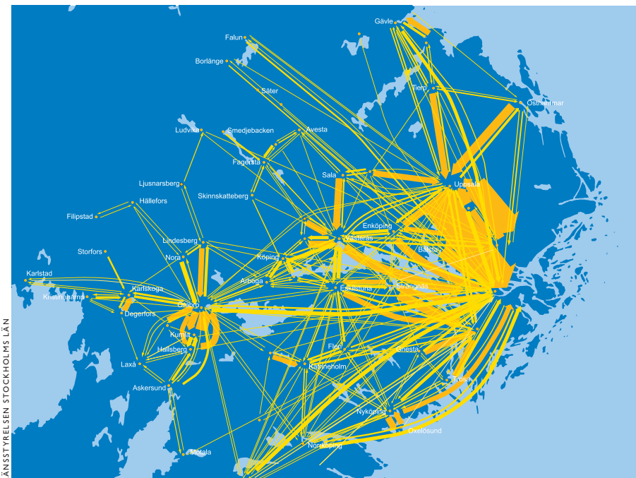
Bra för Stockholm, bra för Sverige. En allt mer sammanhållen region gör Stockholm–Mälardalen till en stark ekonomisk motor för hela landet.

En förstärkning av den pågående regionaliseringen i Stockholm–Mälarenregionen är avgörande för att regionens potential ska kunna tas till vara och för att visionen ska bli verklighet. Det krävs en stark samsyn och beslutskraft hos de olika offentliga aktörerna i hela Stockholm–Mälarenregionen i en rad gemensamma angelägenheter, inte minst inom transportområdet. Två viktiga regionala samarbeten är Stockholm Business Alliance och Mälardalsrådet.