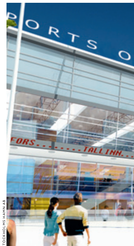
På land, till sjöss. Stockholms strategiska läge är tydligt i Värtan varifrån resenärerna snabbt och enkelt tar sig till alla storstäder runt Östersjön.

Stockholm–Mälarenregionens ekonomiska utveckling har en stor betydelse för hela Sveriges tillväxt och det behövs kraftfulla satsningar för att stärka regionen som landets tillväxtmotor. Det ställer krav på att den nationella politiken har ett storstadsperspektiv och beaktar regionens särskilda förutsättningar i form av höga kostnader för boende, lokaler och löner, långa restider, komplexa beslutsprocesser och risk för segregation. Exempelvis måste det kommunala utjämningsystemet förändras och tilldelningen av statliga medel för infrastrukturinvesteringar öka. Det är vidare nödvändigt att den statliga sektorsstyrningen generellt sett blir mer flexibel och harmoniserad än idag, inte minst när det gäller tillämpningen av plan- och bygglagen och miljöbalken.