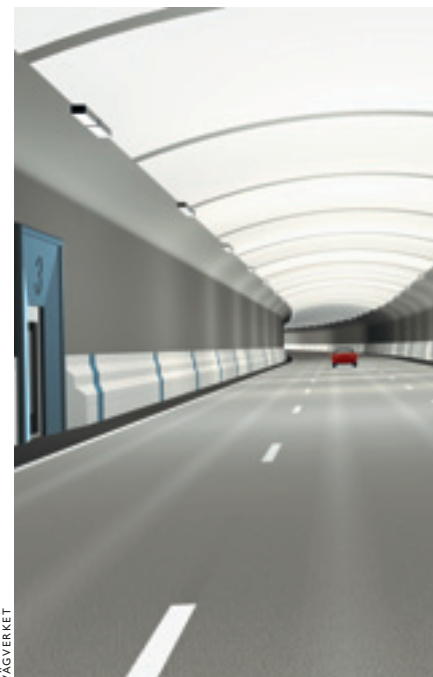
Staden på vatten allt mer under jord. Stockholm får bättre miljö och snabbare transporter med underjordiska trafikleder som Norra länken.

Visionen om det framtida Stockholm är ett strategiskt åtagande från Stockholms stads sida. Alla stadens nämnder och bolagsstyrelser får i uppdrag att arbeta i visionens riktning i sina respektive verksamheter.